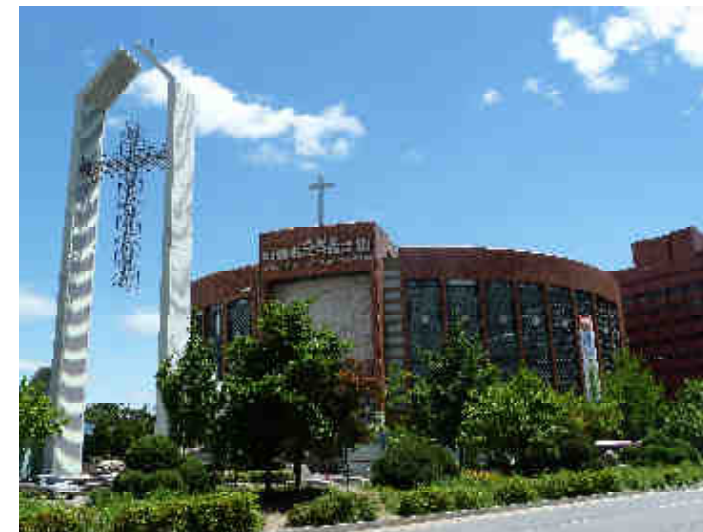
Full Gospel Church